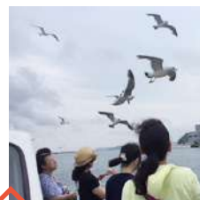
女川湾 クルージング