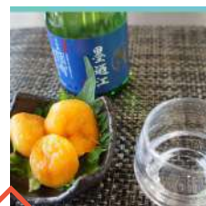
熟成日本酒と楽しむほや