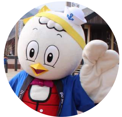
女川町公式キャラクター シーパルちゃん