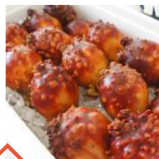
船上ほや捌き体験