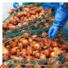
獲ったどー ほや収穫体験