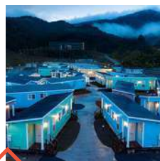
駅から徒歩一分 ホテルエルファロ でゆったり